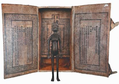
清乾隆九年（1744）针灸铜人像

《本草纲目》是明朝医药学家李时珍“采录八百余家”，考证诸家本草，历时近30年修撰而成的医学巨著。迄今，《本草纲目》已有160个版本，明万历二十一年（1593）《本草纲目》金陵初刊本正是它的祖本（最初的刻本），也是最接近李时珍所撰原著面貌的版本。